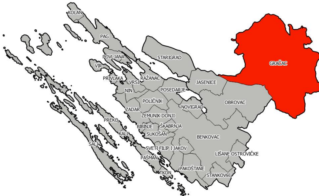
Slika 1: Položaj Općine Gračac u Zadarskoj županiji

Područje općine prostire se na površini od 957,19 km 2 odnosno na 26,25% ukupne površine Zadarske županije koja iznosi 3.646,57 km 2 . Prema površini Općina Gračac je najveća u Županiji, no iako je prostorno velika, najslabije je naseljena općina Zadarske županije.