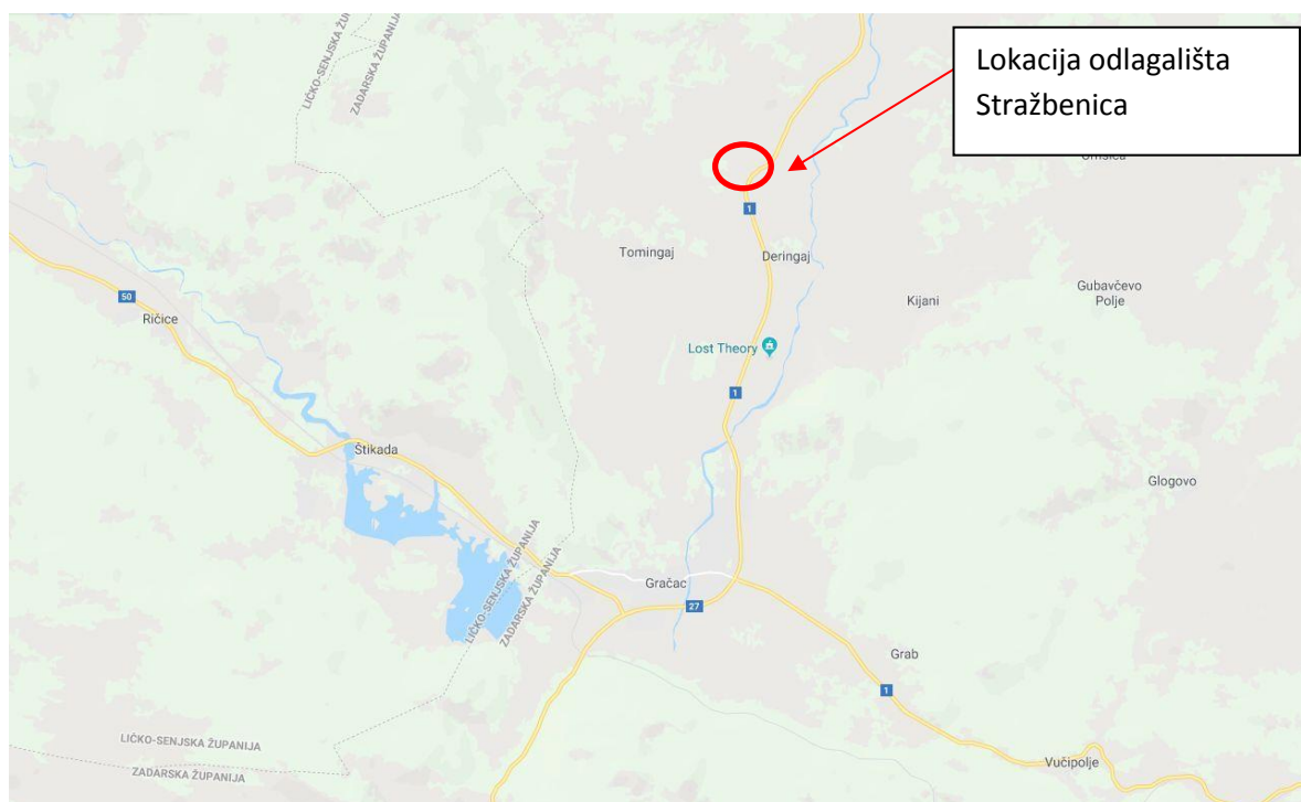
Slika 3: Lokacija odlagališta otpada Stražbenica

Odlagalište otpada Stražbenica nalazi se oko 7 km sjeverno od Gračaca, na lokaciji Gola Glava, na području katastarske općine Deringaj, zapadno od državne ceste D-1 (Zagreb-Karlovac-Slunj-Korenica-Udbina-Gračac-Obrovac).