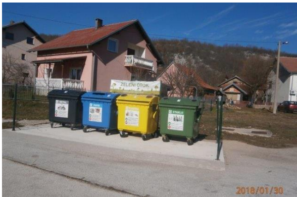
Slika 6. Prikaz zelenog otoka u naselju Gračac

Prikupljanje otpada sa zelenih otoka obavlja tvrtka GRAČAC ČISTOĆA d.o.o., a prikupljeni otpad odlaže na lokaciju Stražbenica.